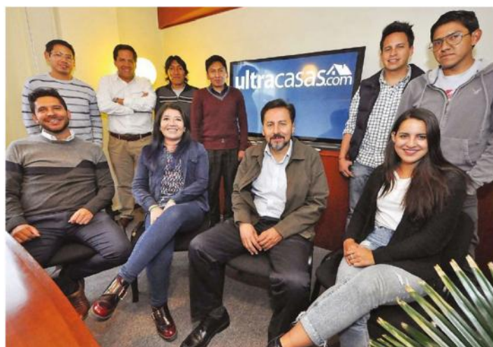
“Al comenzar, el equipo (del portal ultracapas.com ) era de dos personas y ahora está formado por diez. La estrategia de la empresa se basa en el marketing digital. “Hemos sido entrenados por una agencia de exgerentes de Google y Twitter. Ellos supervisan nuestras campañas hoy en día. Eso nos permite tener un nivel de marketing digital muy avanzado”, señaló el cofundador. Al momento de la elaboración de esta nota, la página de Facebook del portal tenía más de 55 mil “Me gusta”. Fuente ilustración y texto de la misma: http://www.paginasiete.bo/inversion/2016/11/13/ultracapas-com-portal-reune-inmobiliarias-pais-116802.html

http://www.emol.com/noticias/Economia/2017/09/19/875506/Startup-chilena-apuesta-por-la-bicicleta-para-el-desarrollo-del-turismo-sustentable-en-Latinoamerica.html