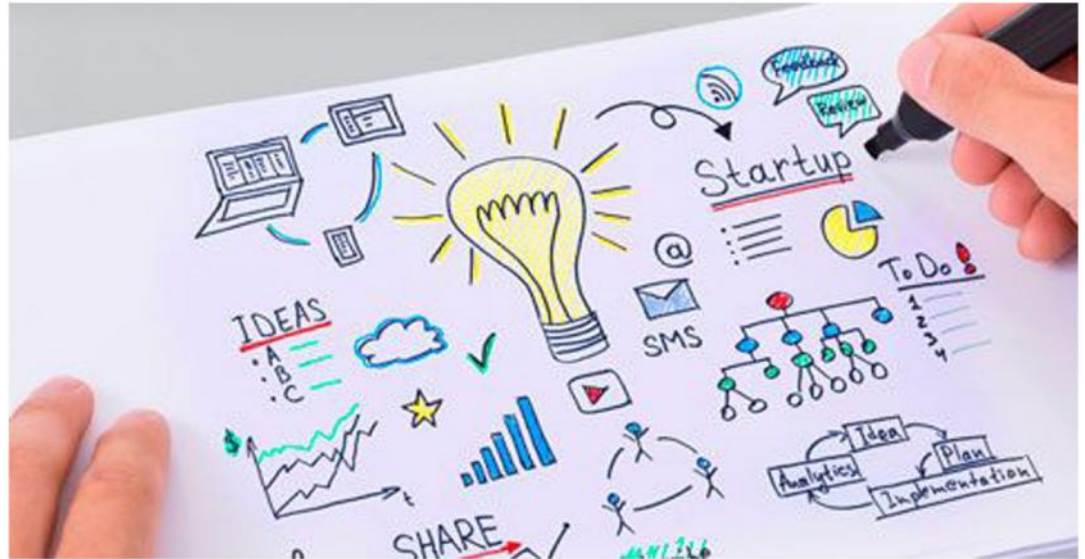
«El objetivo de la mayoría de las startups recae en el hecho de simplificar procesos y trabajos que resulten complicados para otras empresas; esto les permitirá proporcionar una experiencia de uso simplificada. Por ello, es que siempre ofrecen proyectos innovadores con la finalidad de desarrollar tecnología mucho más útil para los consumidores.»

Por supuesto, los negocios de acelerado crecimiento son un componente fundamental de las startups. Dichas pequeñas empresas atraen a inversores ángeles con capital monetario e inteligente a sus nuevas compañías con inversiones no muy altas en comparación a grandes proyectos. Las emergentes se distinguen por su riesgo y también por ofrecer o esperar grandes recompensas, gracias a la escalabilidad exponencial de su negocio. Es decir, tienen o suelen tener un bajo coste de implementación, un riesgo más alto, y una retroalimentación de la inversión potencial más atractiva.