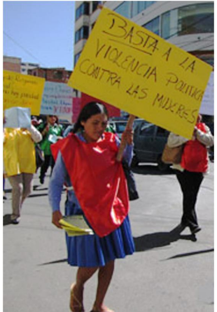
La política debe ser un espacio de servicio, no de reproducción de las taras e injusticias que son necesarias eliminar.

políticamente correcto es un mecanismo psicológico muy fuerte al que lamentablemente muchas mujeres son sometidas. Es el reflejo de una naturalización del sometimiento y subordinación de las mujeres dentro del patriarcado.