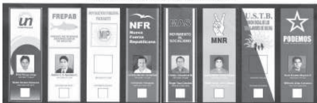
Partidos y candidatos que se presentaron en las elecciones del 2005.