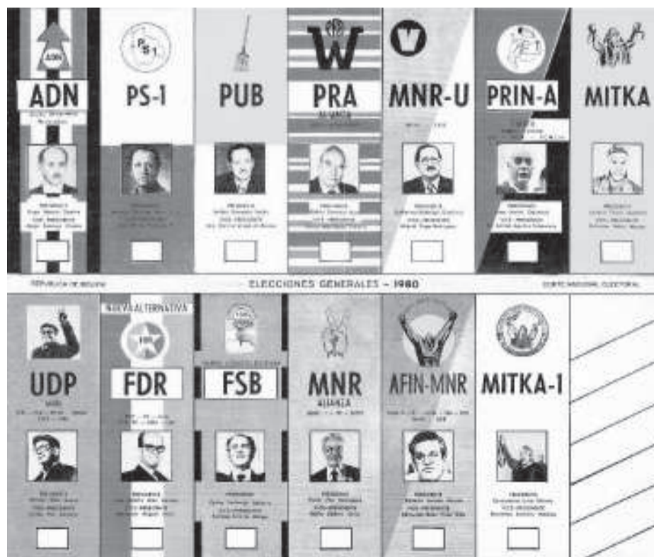
Los candidatos de los diferentes partidos en la papeleta multisigla de las elecciones de 1980.

Considerada la mejor alianza política de fines del siglo XX, el MNR se une con el MRTKL y presenta a Sánchez de Lozada como Presidente, su acompañante fue Víctor Hugo Cárdenas; su propuesta (“El Plan de Todos”) era una transformación total del Estado: nueva reforma educativa, nueva reforma agraria, reconocimiento de todos los idiomas de Bolivia, modificar la CPE reconociendo a Bolivia como multiétnica y pluricultural. Este binomio ganó en ocho de los nueve departamentos del país (menos en Pando) y la votación fue de 585.837 votos (35.55%).