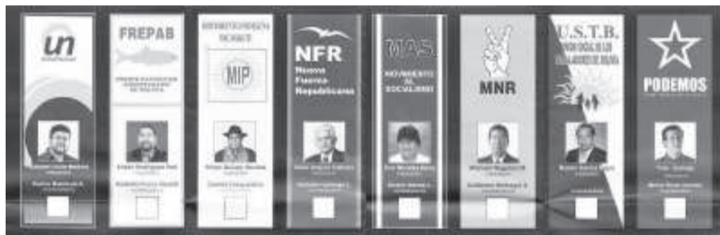
CANDIDATOS A DIPUTADOS UNINOMINALES

Para conocimiento de todos, el Art. 166° de la Nueva Constitución establece que en caso de que ninguno de los candidatos obtenga el 50% más uno de los votos, habrá segunda vuelta electoral entre los dos más votados. Sin embargo, si el primero tiene un mínimo del 40% de los votos y una distancia de 10% sobre el segundo, se proclamará automáticamente al primero como ganador sin necesidad de la segunda vuelta.